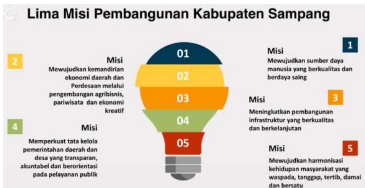
Gambar 3.1 Misi Pembangunan Kabupaten Sampang Tahun 2019-2024