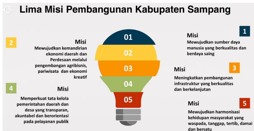
Gambar 3.1 Misi Pembangunan Kabupaten Sampang Tahun 2019-2024

Dari visi-misi diatas, tugas dan fungsi Kecamatan Pangarengan mendukung pada pencapaian misi 4 yaitu "Memperkuat tata kelola pemerintahan dan desa yang transparan, akuntabel dan berorientasi pada pelayanan publik" . Program aksi yang tertuang dalam RPJMD terkait dengan tugas dan fungsi Kecamatan Pangarengan yaitu Optimalisasi transparansi dan akuntabilitas penyelenggaraan kinerja pemerintahan daerah. Program aksi tersebut kelak akan dijabarkan dalam program dan kegiatan Perangkat Daerah.