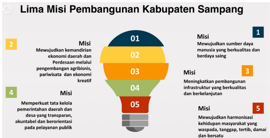
Gambar 3.1 Misi Pembangunan Kabupaten Sampang Tahun 2019-2024

Dari visi-misi diatas, tugas dan fungsi Dinas Komunikasi dan Informatika mendukung pada pencapaian misi 4 yaitu “Memperkuat tata kelola pemerintahan dan desa yang transparan, akuntabel dan berorientasi pada pelayanan publik” . Program aksi yang tertuang dalam RPJMD terkait dengan tugas dan fungsi Dinas Komunikasi dan Informatika yaitu meningkatkan penyelenggaraan pemerintahan yang akuntabel, efektif dan efisien yang didukung dengan kompetensi aparat yang professional dan system modern berbasis informasi teknologi (IT) menuju e-Government. Program aksi tersebut akan dijabarkan dalam program dan kegiatan Perangkat Daerah.