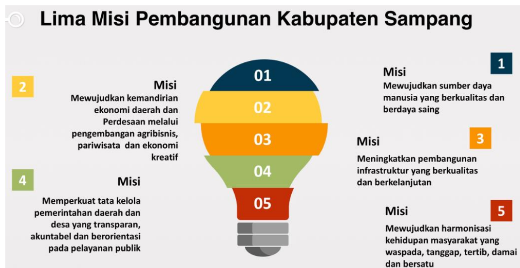
Gambar 3.1 Misi Pembangunan Kabupaten Sampang Tahun 2019-2024

Dari visi-misi diatas, tugas dan fungsi Kecamatan Ketapang mendukung pada pencapaian misi 4 yaitu “Memperkuat tata kelola pemerintahan dan desa yang transparan, akuntabel dan berorientasi pada pelayanan publik” . Program aksi yang tertuang dalam RPJMD terkait dengan tugas dan fungsi Kecamatan Ketapang yaitu Optimalisasi transparansi dan akuntabilitas penyelenggaraan kinerja pemerintahan daerah. Program aksi tersebut kelak akan dijabarkan dalam program dan kegiatan Perangkat Daerah.