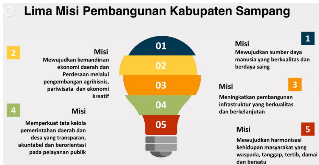
Gambar 3.1 Misi Pembangunan Kabupaten Sampang Tahun 2019-2024

Dari visi-misi diatas, tugas dan fungsi Kecamatan Jrengik mendukung pada pencapaian misi 4 yaitu “Memperkuat tata kelola pemerintahan dan desa yang transparan, akuntabel dan berorientasi pada pelayanan publik” . Program aksi yang tertuang dalam RPJMD terkait dengan tugas dan fungsi Kecamatan Torjun yaitu Optimalisasi transparansi dan akuntabilitas penyelenggaraan kinerja pemerintahan daerah. Program aksi tersebut kelak akan dijabarkan dalam program dan kegiatan Perangkat Daerah.