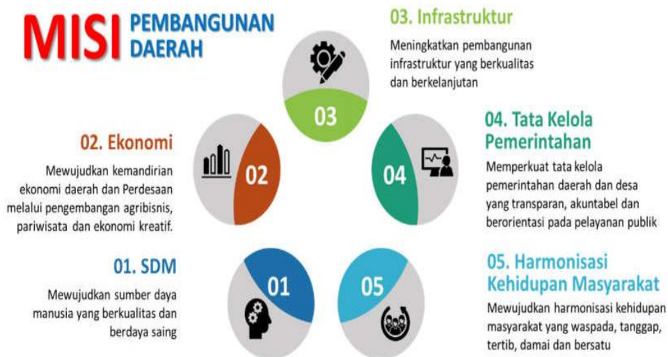
Gambar 3.1 Misi Pembangunan Kabupaten Sampang Tahun 2019-2024

Dari visi-misi di atas, tugas dan fungsi BKPSDM Kabupaten Sampang mendukung pada pencapaian misi-4 yaitu “Memperkuat tata kelola pemerintahan dan desa yang transparan, akuntabel dan berorientasi pada pelayanan publik” . Adapun tujuan misi ini adalah Terselenggaranya reformasi birokrasi melalui tata kelola pemerintahan dan desa yang profesional dan berorientasi pada pelayanan publik . Pencapaian sasaran tersebut, BKPSDM Kabupaten Sampang bertanggung jawab dalam pencapaian indikator sasaran ““ . Program aksi yang tertuang dalam P-RPJMD terkait dengan tugas dan fungsi BKPSDM yaitu Peningkatan kualitas ASN. Program aksi tersebut kelak akan dijabarkan dalam program dan kegiatan Perangkat Daerah.