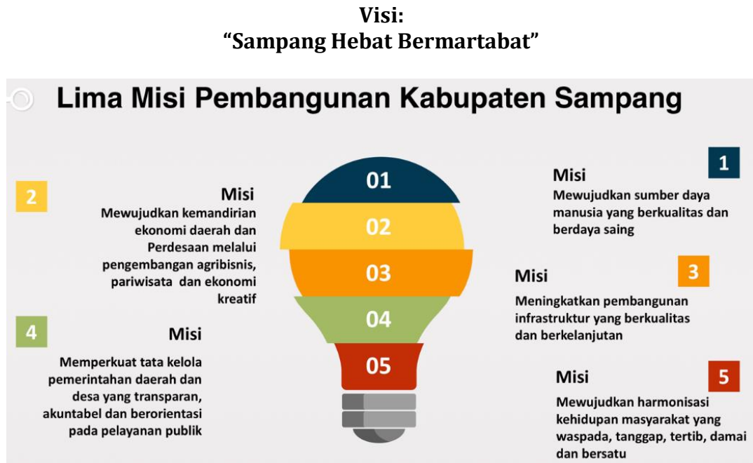
Gambar 3.1 Misi Pembangunan Kabupaten Sampang Tahun 2019-2024

Bagian ini mengemukakan apa saja tugas dan fungsi Kecamatan Robatal yang terkait dengan visi, misi, serta program kepala daerah dan wakil kepala daerah terpilih. Adapun visi dan misi tersebut tertuang dalam RPJMD Kabupaten Sampang Tahun 2019-2024 sebagaimana berikut: