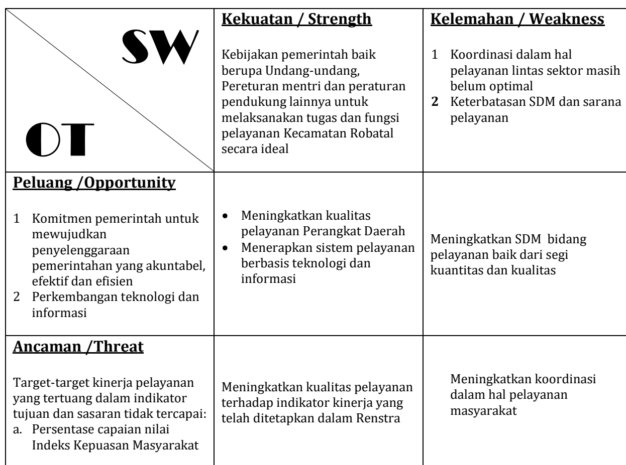
Tabel 5.2 Analisis SWOT dalam Peta Strategi Kecamatan Robatal Kabupaten Sampang

Sumber : Kecamatan Robatal Kabupaten Sampang, 2019