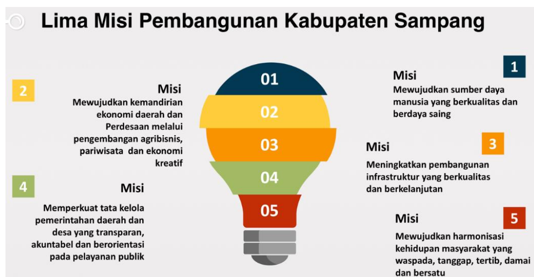
Gambar 3.1 Misi Pembangunan Kabupaten Sampang Tahun 2019-2024

Dari visi-misi diatas, tugas dan fungsi Kecamatan Tambelangan mendukung pada pencapaian misi 4 yaitu “Memperkuat tata kelola pemerintahan dan desa yang transparan, akuntabel dan berorientasi pada pelayanan publik” . Program aksi yang tertuang dalam RPJMD terkait dengan tugas dan fungsi Kecamatan Tambelangan yaitu Optimalisasi transparansi dan akuntabilitas penyelenggaraan kinerja pemerintahan daerah. Program aksi tersebut kelak akan dijabarkan dalam program dan kegiatan Perangkat Daerah.