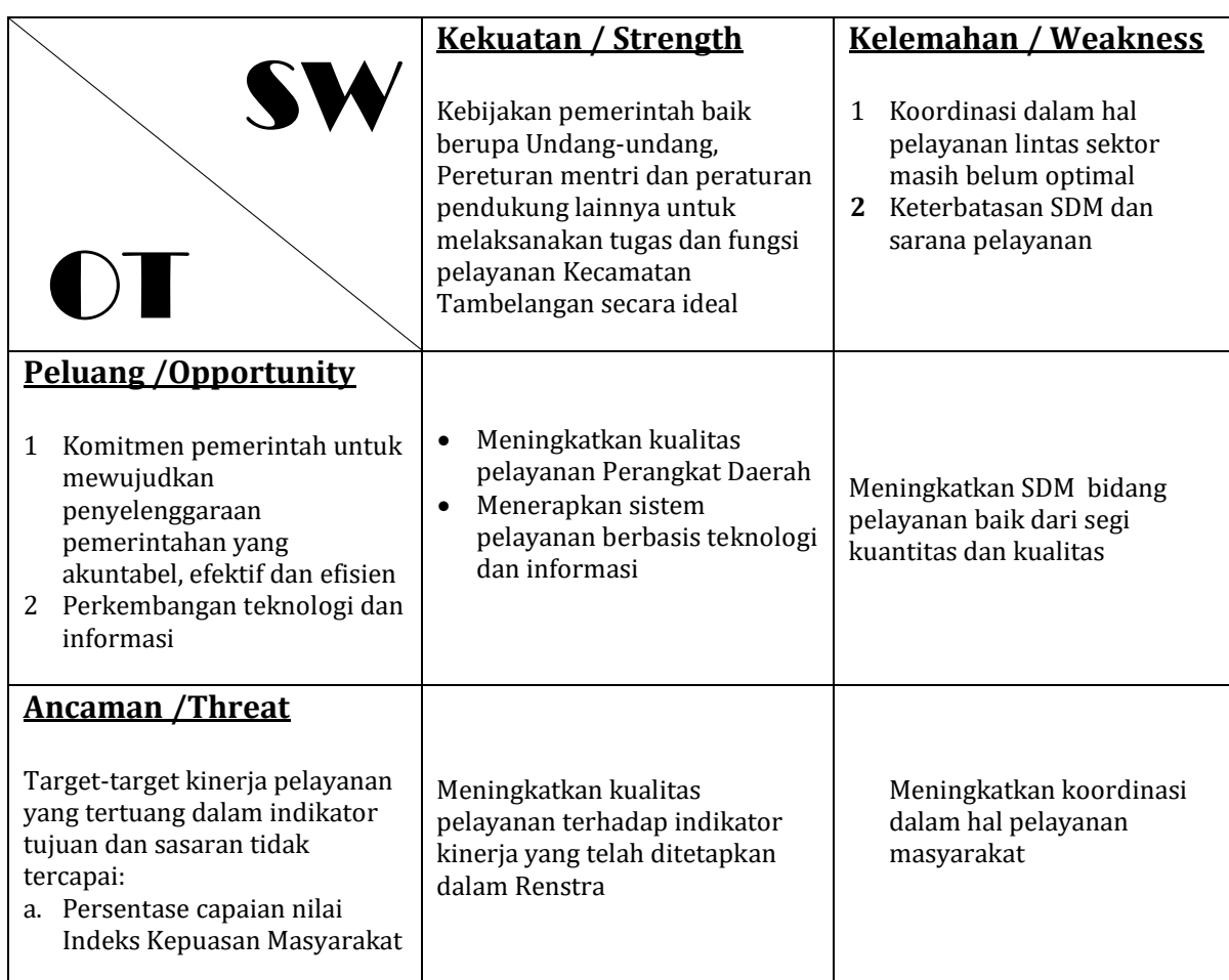
Tabel 5.2 Analisis SWOT dalam Peta Strategi Kecamatan Tambelangan Kabupaten Sampang