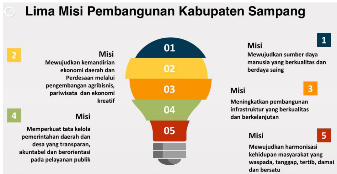
Gambar 3.1 Misi Pembangunan Kabupaten Sampang Tahun 2019-2024

Dari visi-misi diatas, tugas dan fungsi Bappelitbangda mendukung pada pencapaian misi 4 yaitu “Memperkuat tata kelola pemerintahan dan desa yang transparan, akuntabel dan berorientasi pada pelayanan publik” . Program aksi yang tertuang dalam RPJMD terkait dengan tugas dan fungsi Bappelitbangda yaitu Optimalisasi transparansi dan akuntabilitas penyelenggaraan kinerja pemerintahan daerah. Program aksi tersebut kelak akan dijabarkan dalam program dan kegiatan Perangkat Daerah.