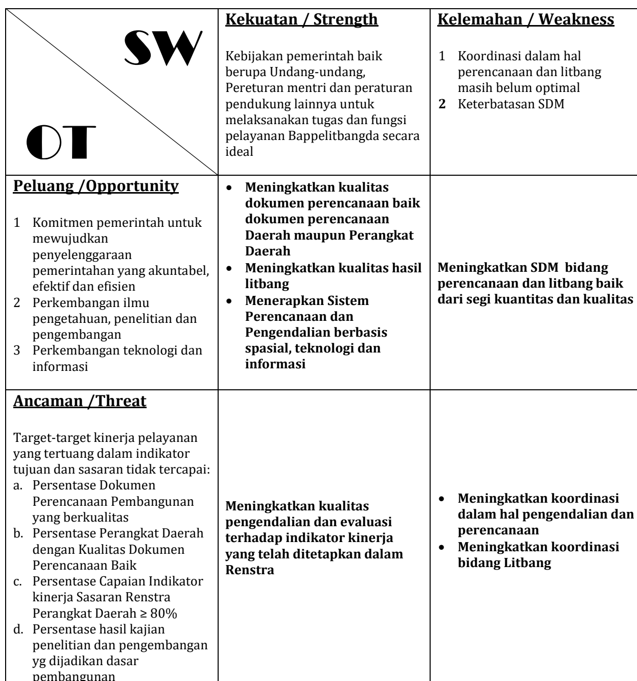
Tabel 5.2 Analisis SWOT dalam Peta Strategi Bappelitbangda Kabupaten Sampang