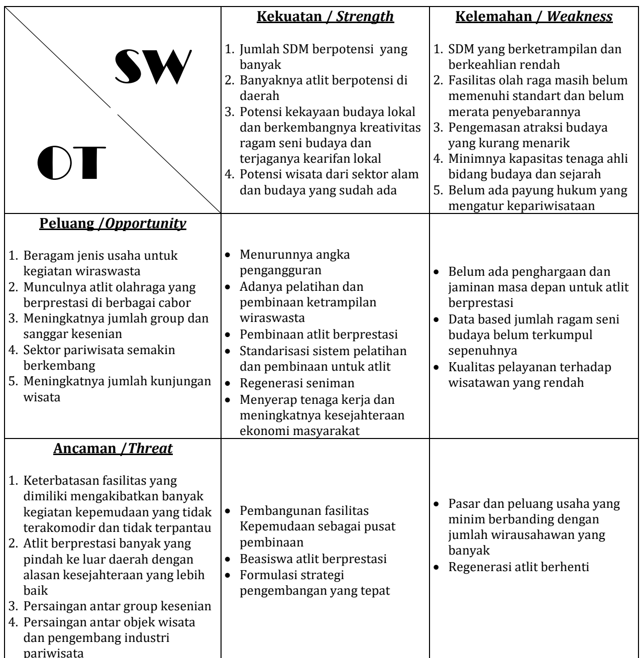
Tabel 2.3 Analisis SWOT dalam Peta Strategi Dinas Pemuda, Olahraga, Kebudayaan dan Pariwisata Kabupaten Sampang