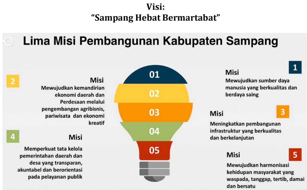
Gambar 3.1 Misi Pembangunan Kabupaten Sampang Tahun 2019-2024

Bagian ini mengemukakan apa saja tugas dan fungsi Kecamatan Camplong yang terkait dengan visi, misi, serta program kepala daerah dan wakil kepala daerah terpilih. Adapun visi dan misi tersebut tertuang dalam RPJMD Kabupaten Sampang Tahun 2019-2024 sebagaimana berikut: