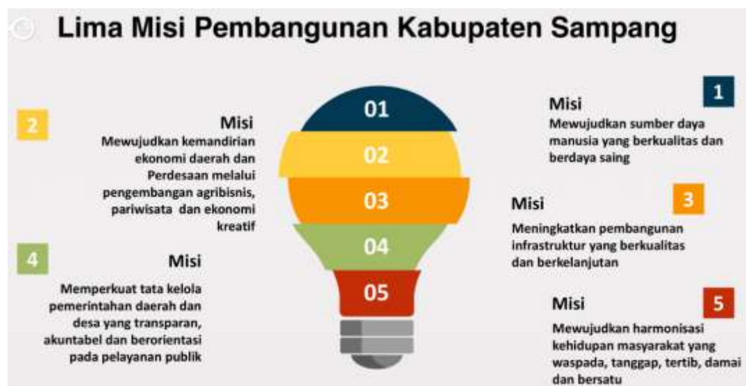
Gambar 3.1 Misi Pembangunan Kabupaten Sampang Tahun 2019-2024

Dari visi-misi diatas, tugas dan fungsi Kecamatan Ketapang mendukung pada pencapaian misi 4 yaitu “Memperkuat tata kelola pemerintahan dan desa yang transparan, akuntabel dan berorientasi pada pelayanan publik” . Program aksi yang tertuang dalam RPJMD terkait dengan tugas dan fungsi Kecamatan Ketapang yaitu Optimalisasi transparansi dan akuntabilitas penyelenggaraan kinerja pemerintahan daerah. Program aksi tersebut kelak akan dijabarkan dalam program dan kegiatan Perangkat Daerah.