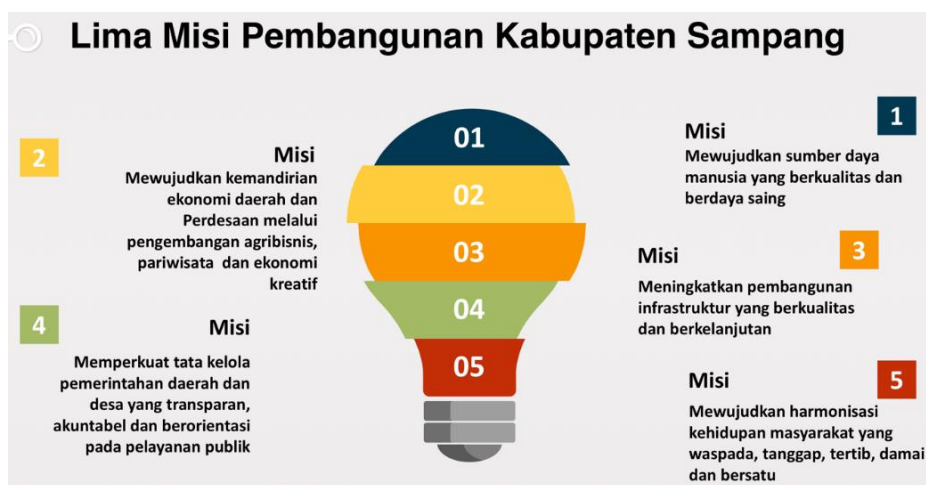
Gambar 3.1 Misi Pembangunan Kabupaten Sampang Tahun 2019-2024

Dari visi-misi diatas, tugas dan fungsi Dinas Perikanan mendukung pada pencapaian misi 2 yaitu “Mewujudkan kemandirian ekonomi daerah dan perdesaan melalui pengembangan agribisnis, pariwisata dan ekonomi kreatif” . Selanjutnya berdasarkan identifikasi permasalahan pelayanan Dinas Perikanan yang dijabarkan pada Tabel 3.2 akan dipaparkan apa saja faktor-faktor penghambat dan pendorong pelayanan Perangkat Daerah yang dapat mempengaruhi pencapaian visi dan misi kepala daerah dan wakil kepala daerah tersebut. Faktor-faktor inilah yang kemudian menjadi salah satu bahan perumusan isu strategis pelayanan Perangkat Daerah.